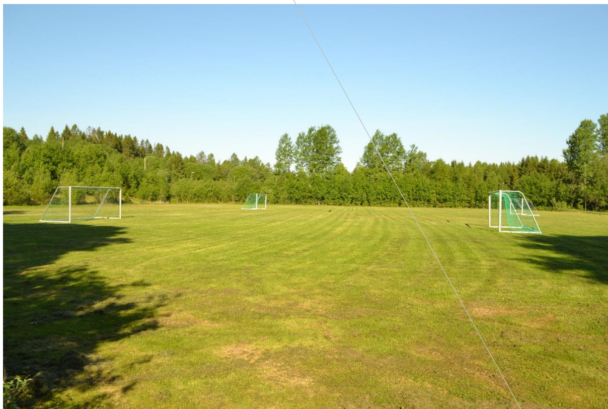
Bjørnebekk treningsfelt i Ås.

Treningsfeltet er ca. 90 x 120 meter og det er i tillegg plenareal med kortklipt plen foran husene. Det gjør at en har mulighet for å trene og gjennomføre konkurranse i alle ni castingøvelsene.